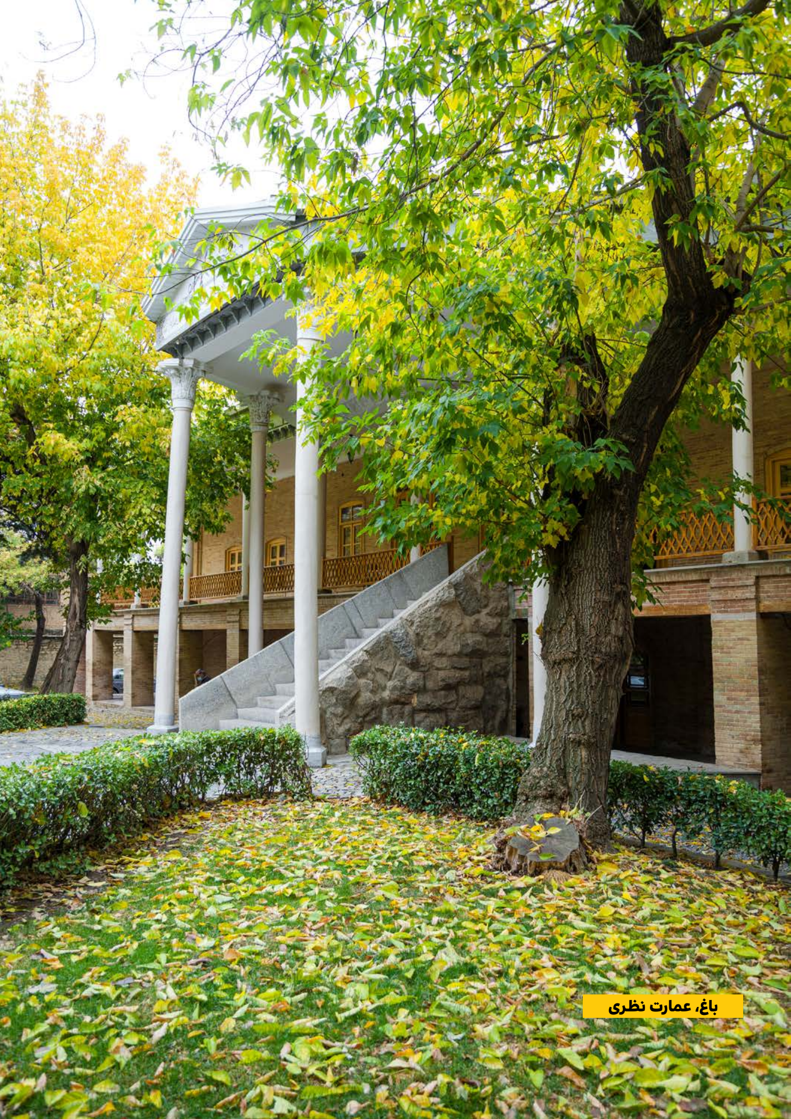
باغ، عمارت نظری