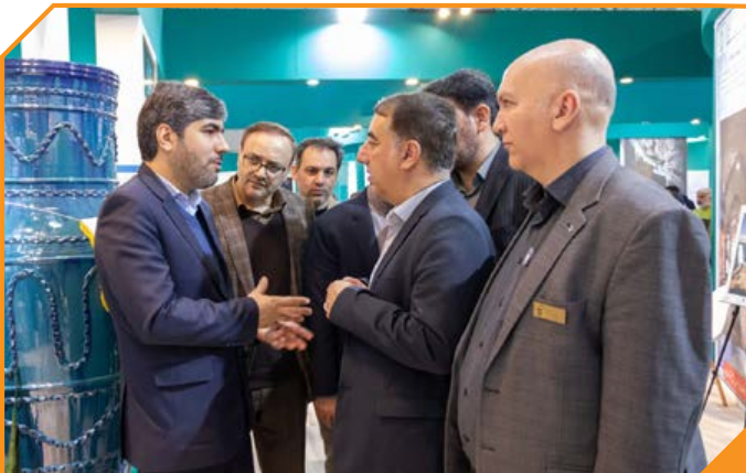
دکتر میثم لطیفی معاون رئیس جمهور و رئیس سازمان امور اداری و استخدامی کشور