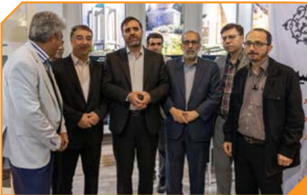
سید مسعود حسینی شهردار همدان