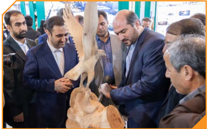
مهندس محسن منصور معاون اجرایی رئیس جمهور و سرپرست نهاد ریاست جمهوری