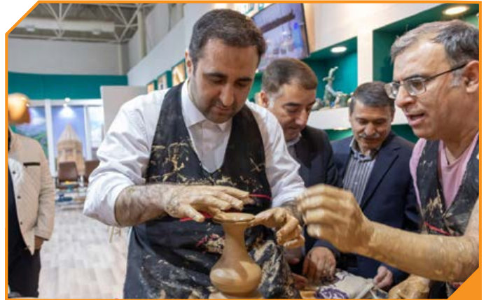
دکتر شالابیان معاون گردشگری وزارت میراث فرهنگی، گردشگری و صنایع دستی