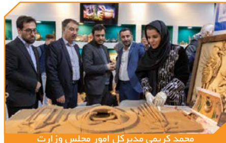
محمد کریمی مدیرکل امور مجلس وزارت میراث فرهنگی، گردشگری و صنایع دستی