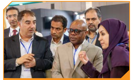
ایزیکا عبدالقدیر امام دبیرکل سازمان همکاری‌های اقتصادی D8