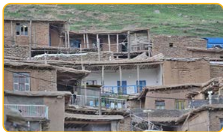
معاون سرمایه‌گذاری همدان خبر داد: