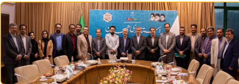
استاندار همدان در نشست با هنرمندان صنایع دستی استان مطرح کرد